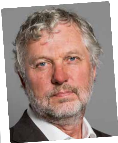
Peter Eriksson