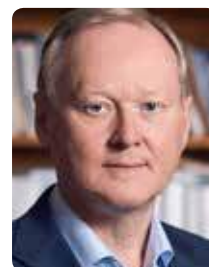
Leif Östling