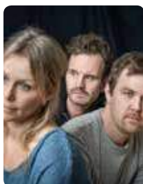
Östra Teatern