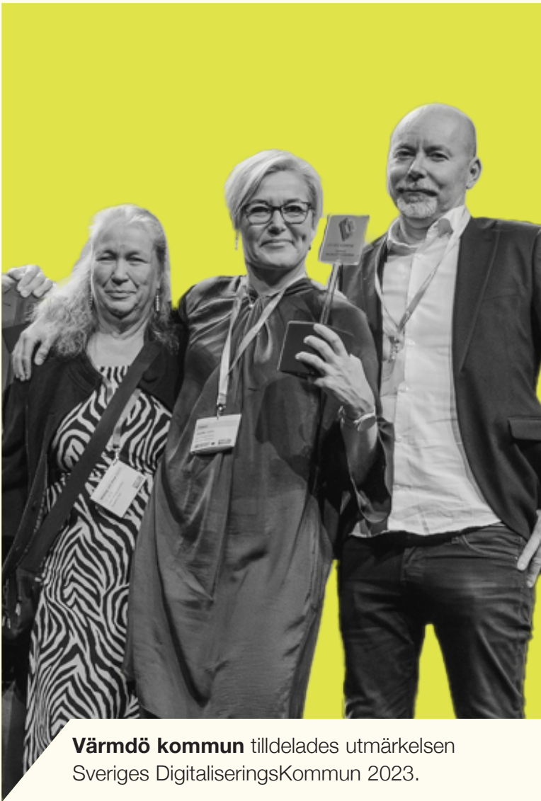
Värmdö kommun tilldelades utmärkelsen Sveriges DigitaliseringsKommun 2023.